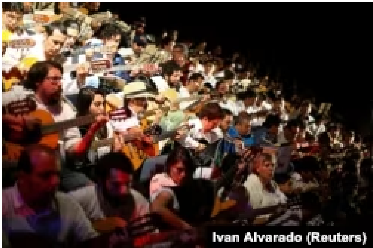
Ivan Alvarado (Reuters)

سال ۲۰۰۳، در سی سالگی قتل خارا استادیوم سانتیاگو را به نام او نامگذاری کردند.