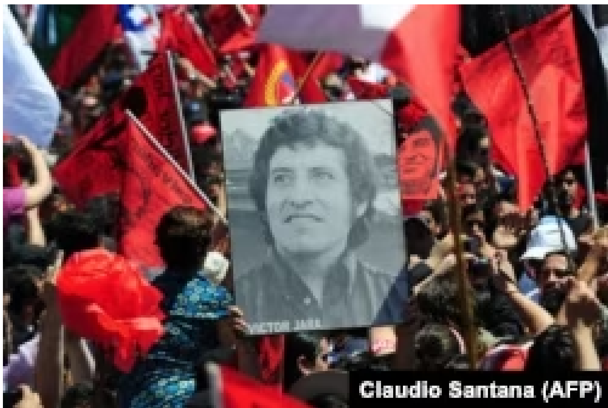
شهروندان سانتیاگو تصاویری از خارا را در زمان دفن مجدد او در سال ۲۰۰۹ بر دست دارند

او همچنین ابراز خشنودی کرد که «حالا ما در شیلی قوه قضائیه‌ای داریم که به مبناها و معیارهای حقوق بشری در جهان تمکین می‌کند و در محاکماتی نوین و مطابق با ارزش‌های عام بشری به اجرای عدالت پایبند است.»